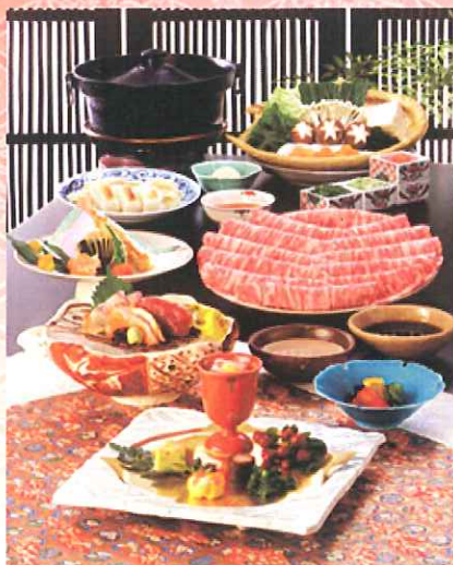
しゃぶしゃぶ会席

新しい年を迎え、木曾路はこれからも美味を追求し、みなさまに満足していただける料理をご用意していきます。より新しく、美味しくなった旬の料理コースをぜひこの機会にご堪能ください。